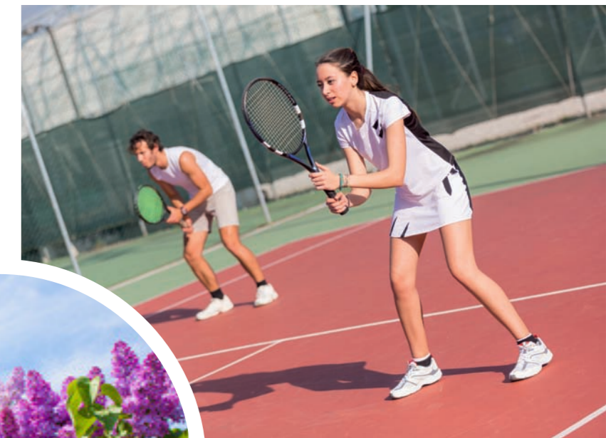
4 terrains de tennis à 2mn