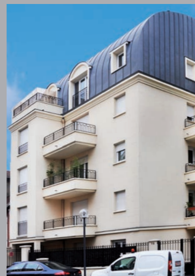
Villa les Bruyères - Les Lilas

SCL LA GENERALE DE PROMOTION 34 - 58 rue Beaubourg 75003 Paris - RCS : 537 551 590 - Document non contractuel - Perspectives illustrations : A. Frononot du Gravier : libre interprétation de l'artiste. Réalisation : Groupe Renaissance Communication - www.groupe-rennaissance.com - 01 42 71 62 42 - Credits photos : Renaissanceprod, Fotolia & Mairie des Lilas - 01/2014