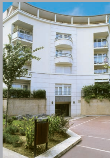
Architecte : Stanislas Hennig