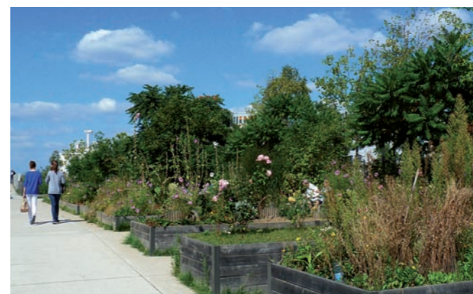
Parcs et Jardins