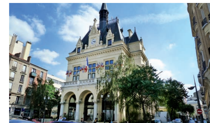
Mairie des Lilas