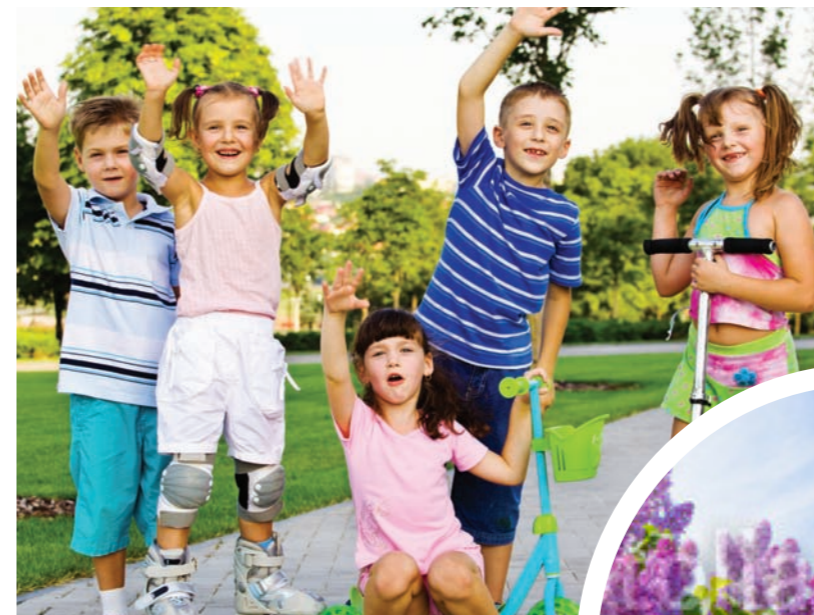
De nombreux parcs et jardins