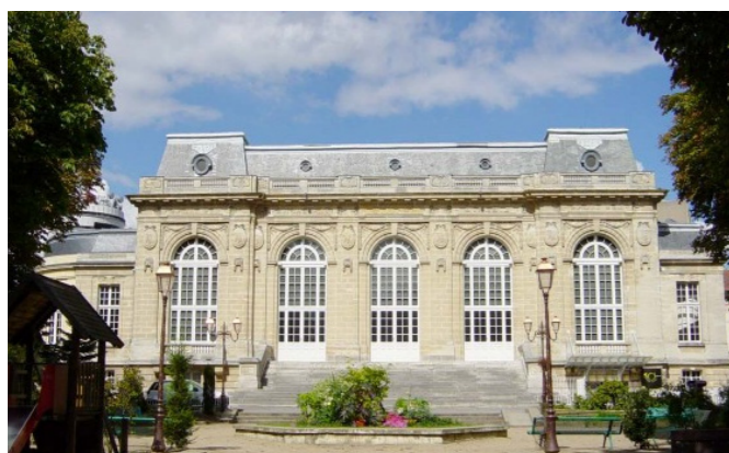
Théâtre du Garde Chasse

Festive et écologique, la ville veille à offrir à tous en permanence des activités de loisirs et de plein air : parcs et jardins, terrains de sports, une piscine, un conservatoire, des animations théâtrales, réalisées par plus de 150 associations de quartiers.