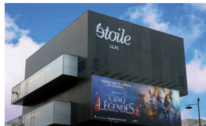
Multiplexe étoile-Ciné, 7 salles